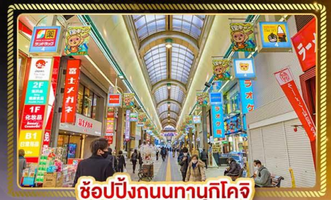
ช้อปปิ้งถนนทานุกุโคจิ