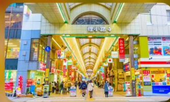
ซุปป์ิงถนนทากูกิโคจิ